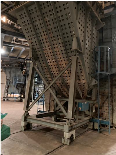
Kraftwerk Lippendorf, Kohlemühle im Kesselhaus R