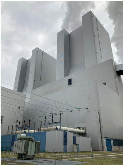
Kraftwerk Lippendorf, östlicher Teil (Block S) des Maschinenhauses, Blick von Südost