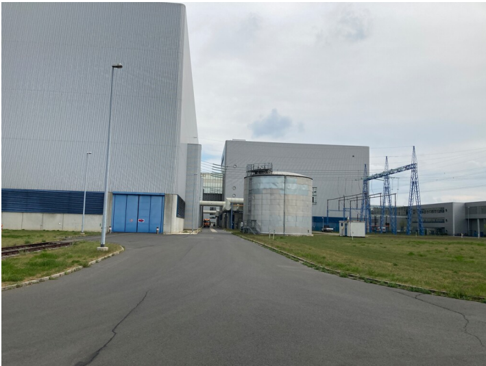
Kraftwerk Lippendorf, Kalkkondensatspeicher R, Ansicht von Osten