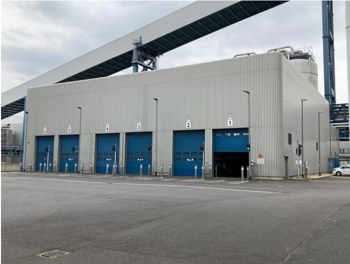
Kraftwerk Lippendorf, Gebäude der Klärschlamm-Mitverbrennung, Nordansicht