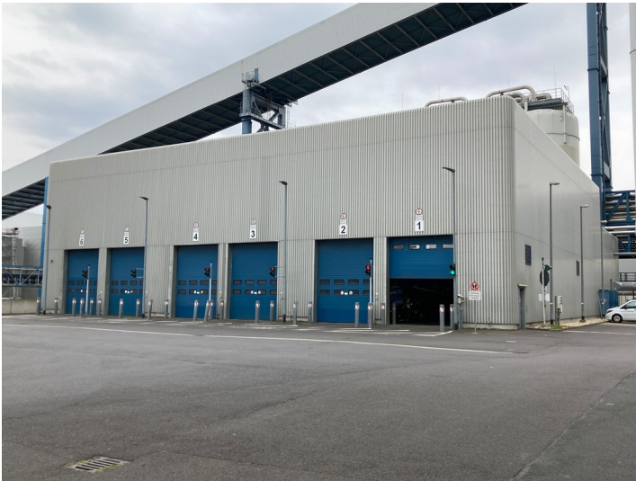
Kraftwerk Lippendorf, Gebäude der Klärschlamm-Mitverbrennung, Nordansicht