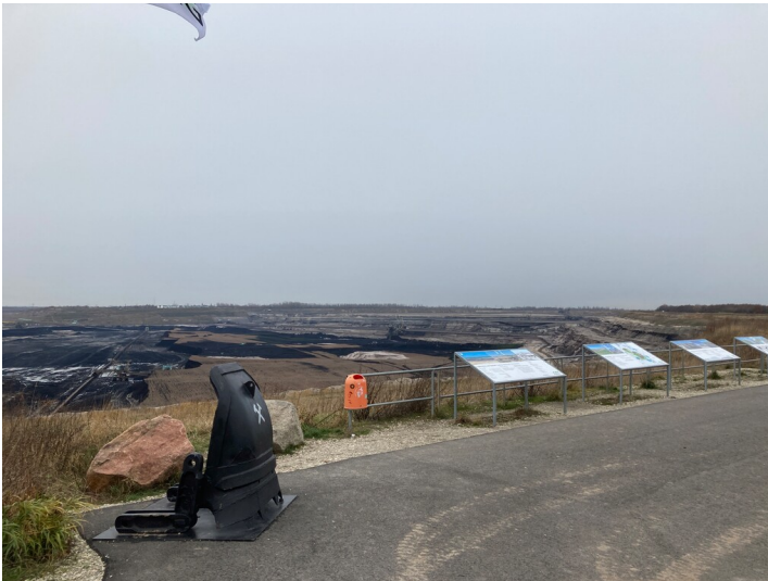
Tagebau Vereinigtes Schleenhain, Aussichtspunkt mit Findlingen, Schautafeln und Ausstellungsobjekt Baggerschaufel, Blick nach Westen