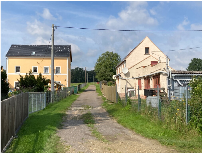
Steigerhaus Braunkohlenwerk Julius & Hahn, Blick nach Nordwesten