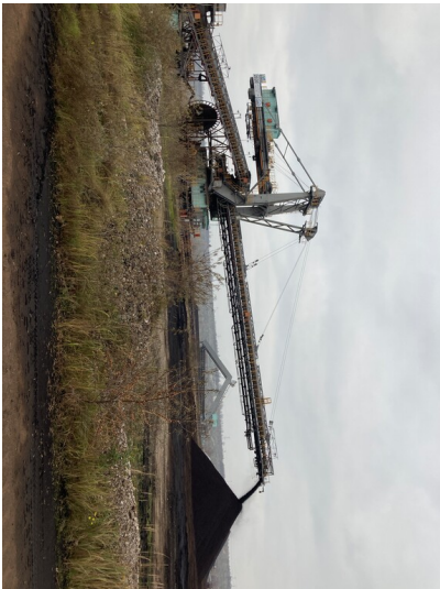
Tagebau Vereinigtes Schleenhain, Zwischenförderer mit Gurtförderband und Schienenfahrwerk