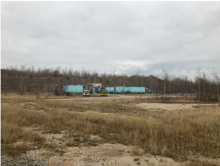
Tagebau Vereinigtes Schleenhain, Umspannwerk Abbaufeld Peres