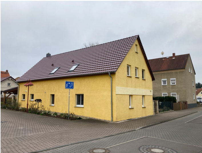
Gut Trübger, Einbau von Werkwohnungen, Blick nach Südost