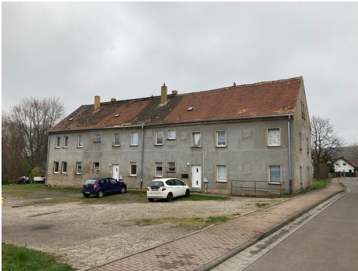
Gut Krobitzsch, Einbau von Werkwohnungen in ehemaliges Stall- und Scheunengebäude, Blick nach Nordost