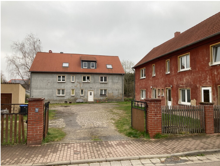
Gut Uhlemann, Einbau von Werkwohnungen, Blick nach Nordost