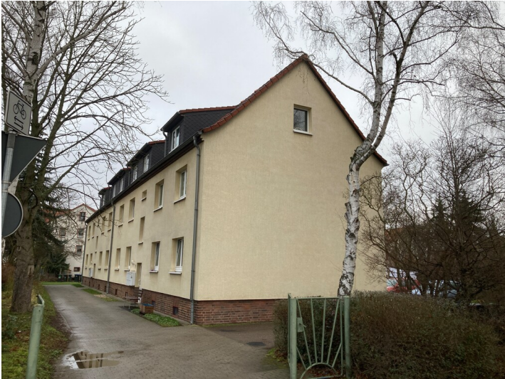
Wohnblock an der Leipziger Straße, Blick nach Nordost