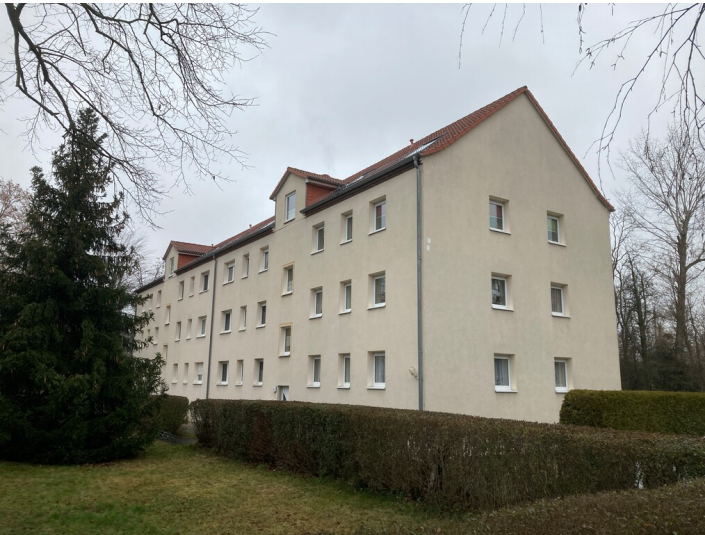
Wohnblöcke an der Leipziger Straße, Blick nach Nordost