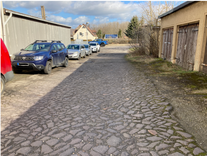
Grube und Braunkohlenwerk Gewerkschaft Margaretha, gepflasterte Zufahrt, Blick nach Osten