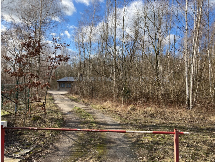
Kraftwerk Thierbach, Schießplatz mit Baracken, Blick von Osten