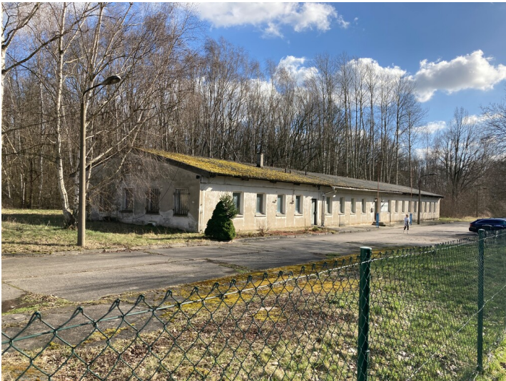
Kraftwerk Thierbach, zwei Baracken in Blockbauweise, Blick von Nordwest