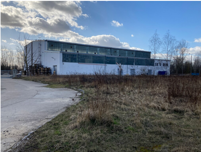
Kraftwerk Thierbach, Halle der Wasseraufbereitung, Blick von Nordost