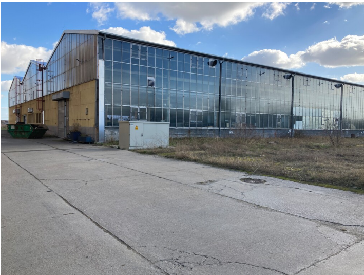
Kraftwerk Thierbach, Werkhalle, Blick von Nordost