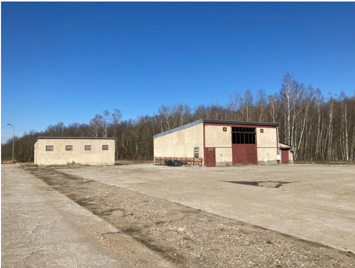
Kraftwerk Thierbach, Garage und Transformatorenstation, Blick von Süden