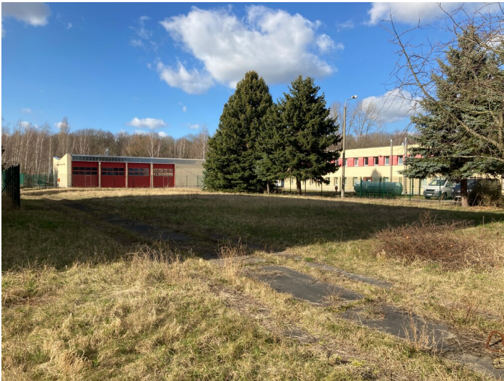
Kraftwerk Thierbach, Garagen und Werkstattgebäude, Blick von Südost