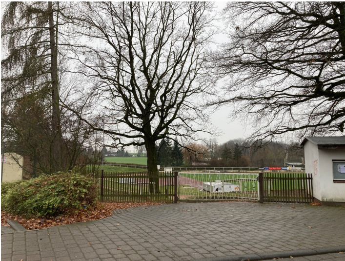
Bergarbeitersiedlung Kitzscher, Stadion der Jugend, Blick von Osten