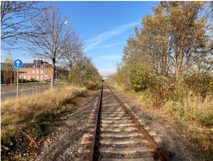
Bahngleisanlage des ehemaligen Braunkohlen- und Großkraftwerks Espenhain, Blick nach Südost