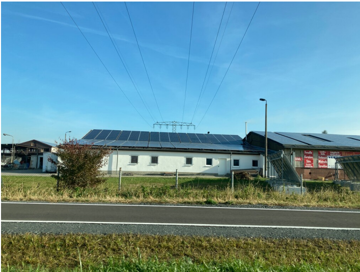
Lagerhallen und Fischeaufzuchtbecken, Blick von Westen