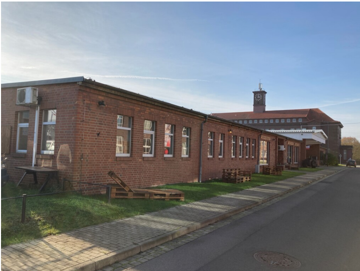
Gebäudekomplex mit früherem Speisesaal, Großküche, Buchladen und Bibliothek, Blick von Nordwest