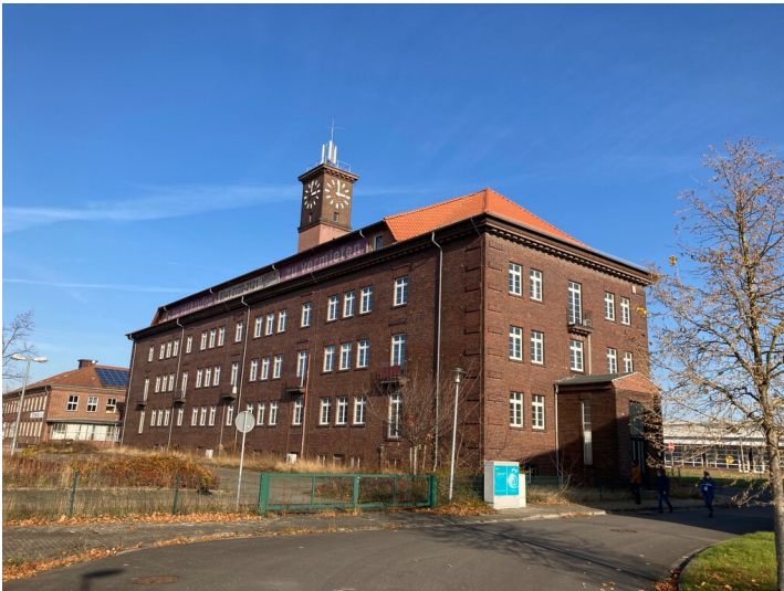
Teil der Objektgruppe ehemaliges Braunkohlenveredelungswerk Espenhain (30100035), Verwaltungsgebäude; Blick von Süden