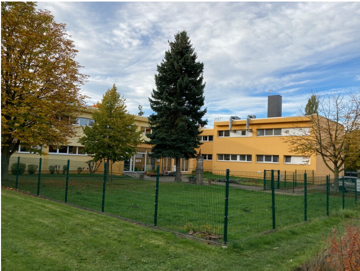
Bergarbeitersiedlung Kitzscher, Kitzscher-Nord, Komplex mit Kinderkrippe und Kindergarten, Blick von Nordost