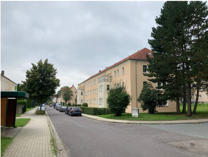
Bergarbeitersiedlung Kitzscher, Mehrfamilienwohnhäuser an der Robert-Koch-Straße, Blick nach Nordwest