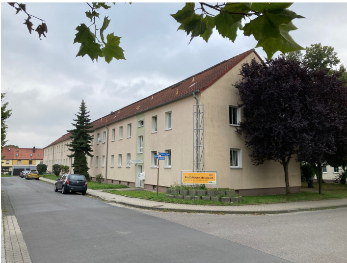
Bergarbeitersiedlung Kitzscher, Wohnblöcke an der Trageser Straße, Blick von Norden