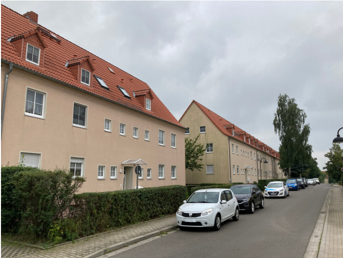
Bergarbeitersiedlung Kitzscher, Mehrfamilienhauszeilen an der Nordstraße, Blick nach Südost