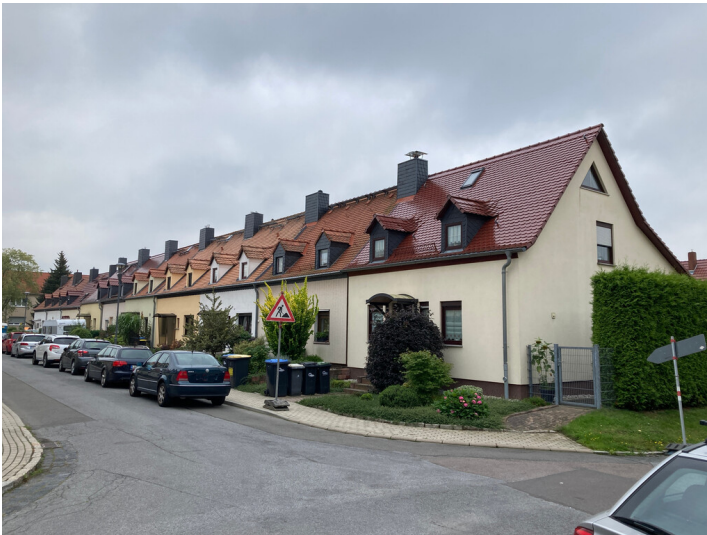
Bergarbeitersiedlung Kitzscher, Reihenhauszeile an der Oststraße, Blick nach Südost