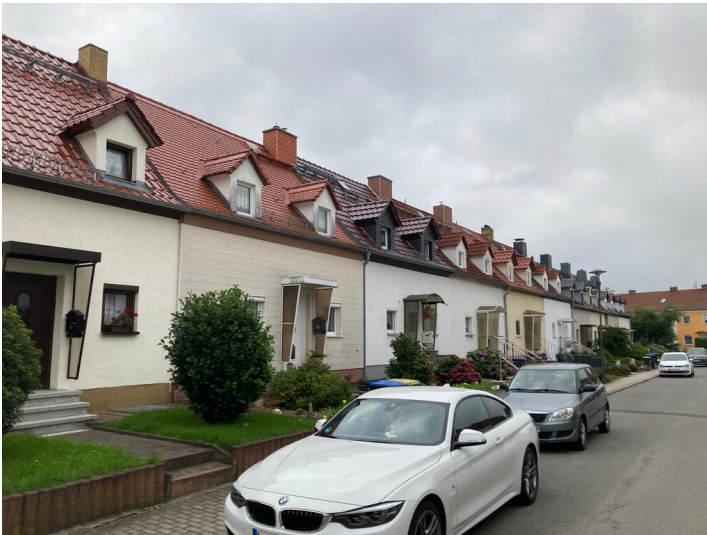
Bergarbeitersiedlung Kitzscher, Reihenhauszeile an der Seebergasse, Blick nach Nordost