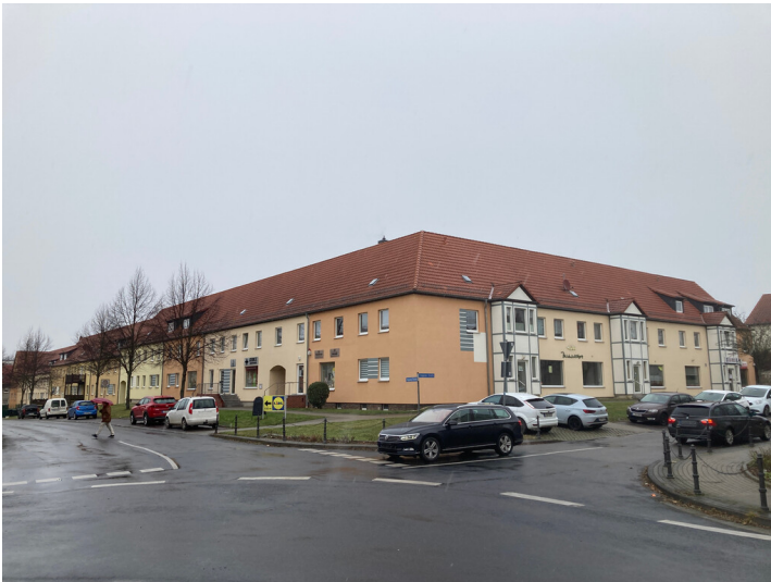
Bergarbeitersiedlung Kitzscher, Wohnanlage an der Trageser Straße, Blick nach Nordost