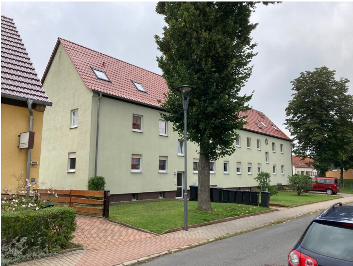
Bergarbeitersiedlung Kitzscher, Mehrfamilienwohnhaus an der Karl-Liebknecht-Straße, Blick von Südwest