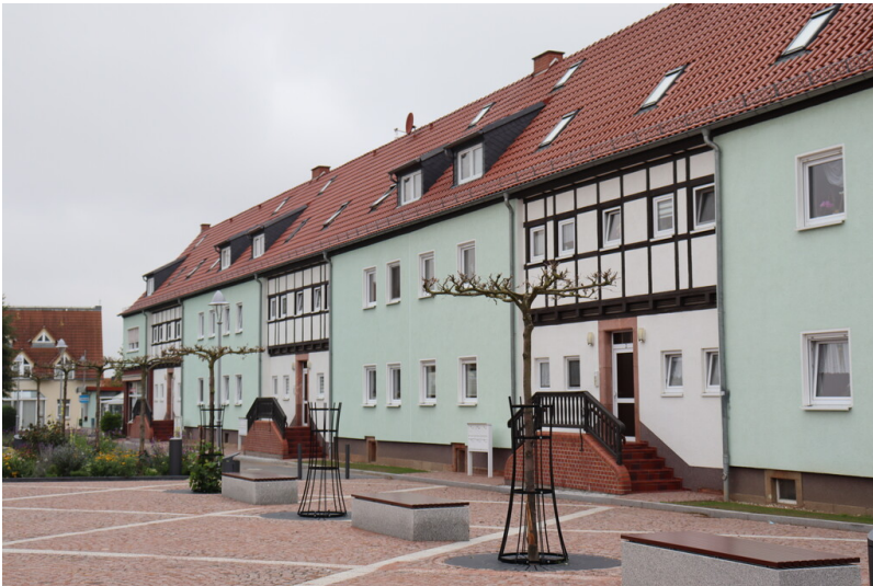
Bergarbeitersiedlung Kitzscher, Hauszeile am Marktplatz, Blick von Südost