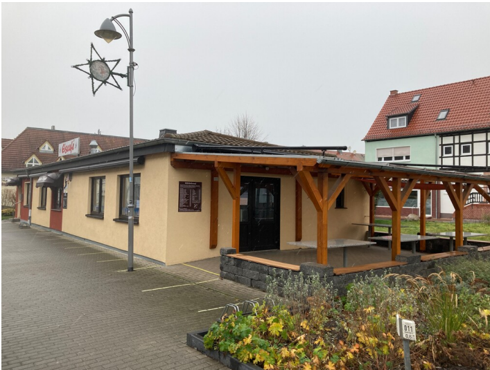
Bergarbeitersiedlung Kitzscher, frühere Bushaltestelle, heute Eiscafé©, Blick von Osten Fotograf/Urheber: Nils Schinker