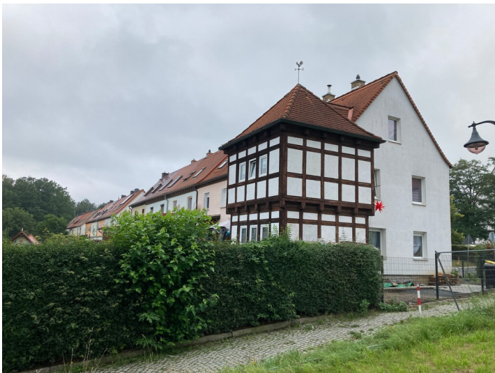
Bergarbeitersiedlung Kitzscher, Reihenhauszeile am Schwarzholzweg, Blick nach Nordwest