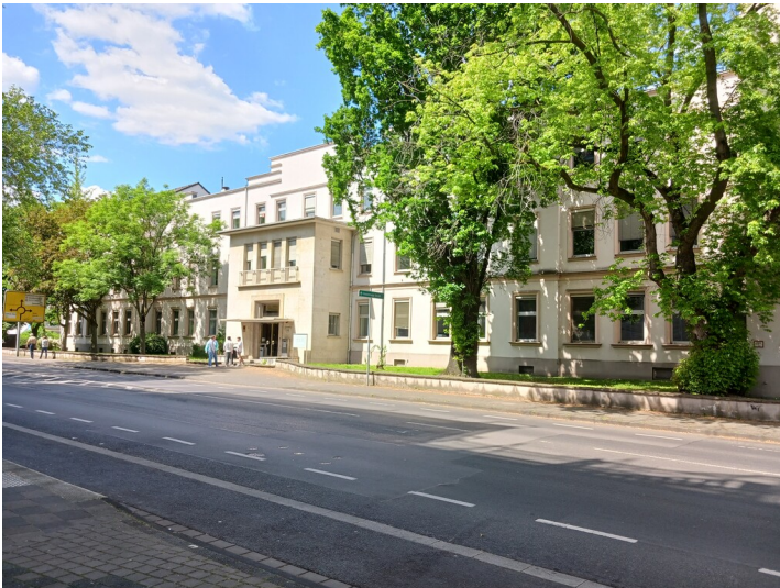
Verwaltung Roddergrube, Brühl, Blick von Südosten auf die Hauptfassade, 19.5.2023