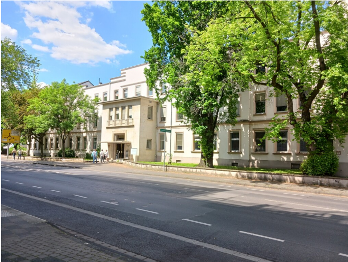
Verwaltung Roddergrube, Brühl, Blick von Südosten auf die Hauptfassade, 19.5.2023