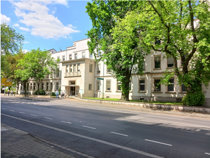
Verwaltung Roddergrube, Brühl, Blick von Südosten auf die Hauptfassade, 19.5.2023