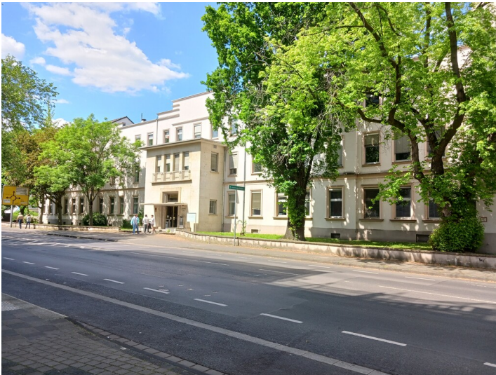
Verwaltung Roddergrube, Brühl, Blick von Südosten auf die Hauptfassade, 19.5.2023