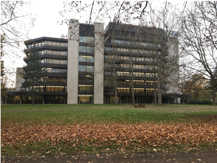
RWE Power Hauptverwaltung, Köln-Junkersdorf, Blick von Westen, 15.11.2020