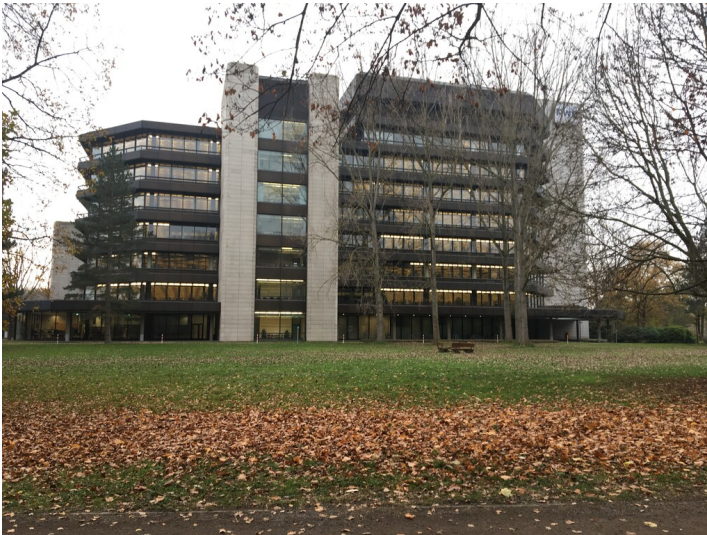
RWE Power Hauptverwaltung, Köln-Junkersdorf, Blick von Westen, 15.11.2020