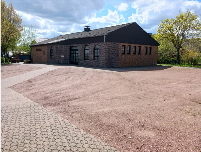
Umsiedlung Pattern, Festhalle Haus Pattern, Blick von Nordosten, 16.4.2023