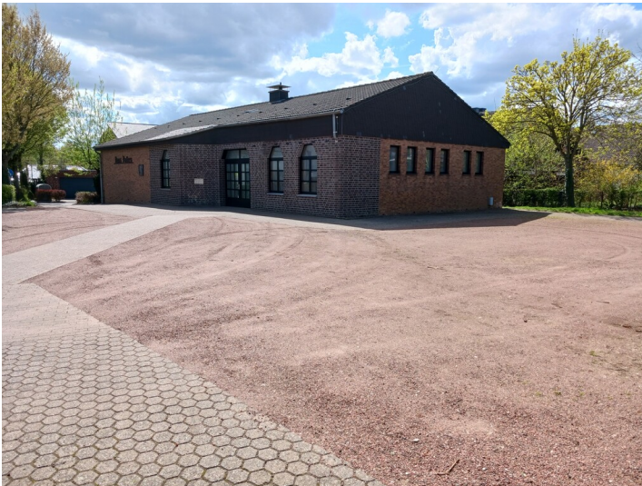
Umsiedlung Pattern, Festhalle Haus Pattern, Blick von Nordosten, 16.4.2023