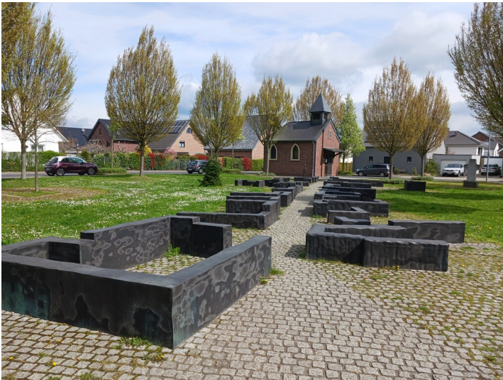
Denkmalplatz Holz, Bodenrelief, Blick von Südwesten, 15.4.2023