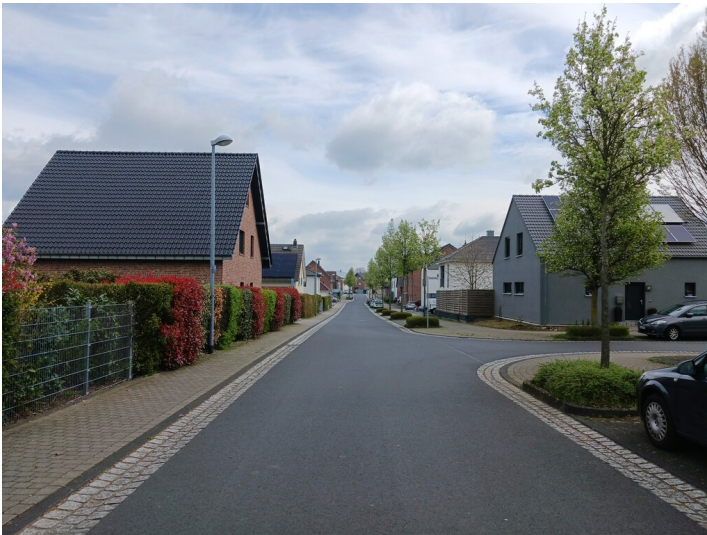
Jüchen-Holz, Straßenbild, 15.4.2023