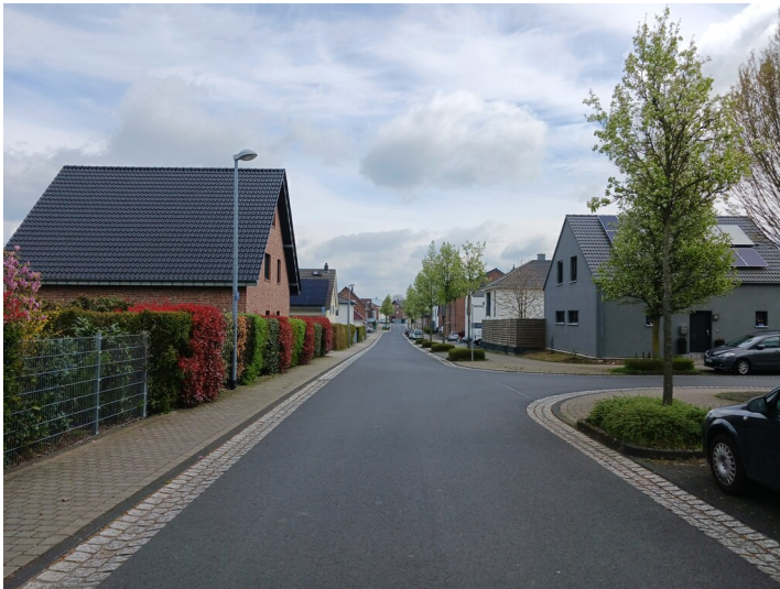
Jüchen-Holz, Straßenbild, 15.4.2023