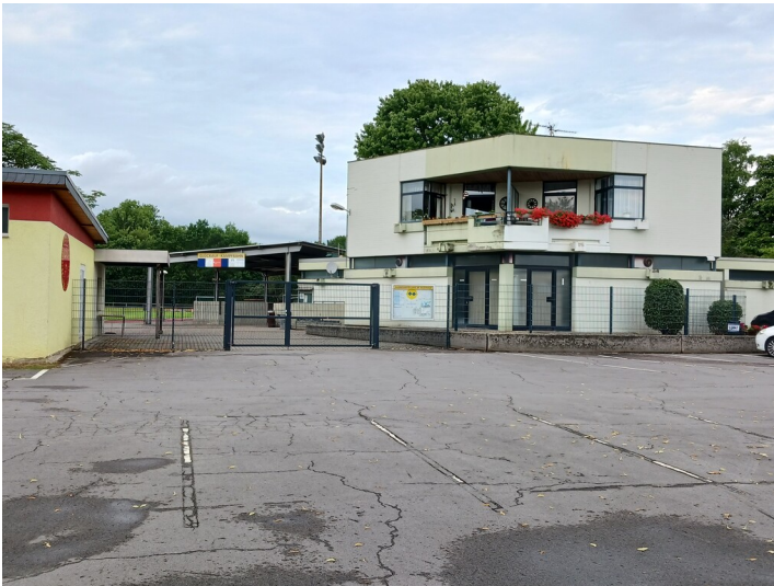
Habbelrath, Glückauf-Kampfbahn und Sportlerheim, Blick von Osten, 15.7.2023