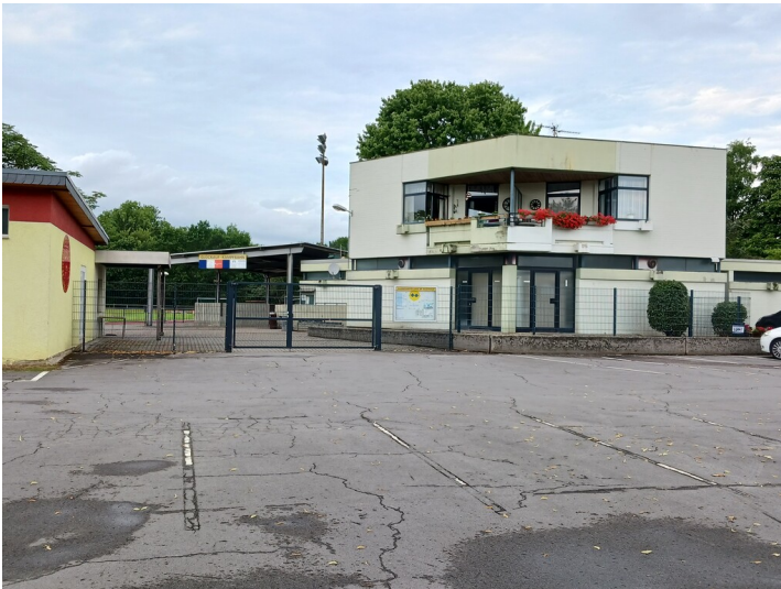
Habelrath, Glückauf-Kampfbahn und Sportlerheim, Blick von Osten, 15.7.2023