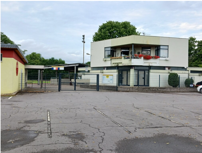
Habelrath, Glückauf-Kampfbahn und Sportlerheim, Blick von Osten, 15.7.2023