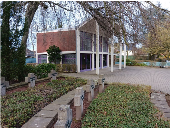
Habbelrath, Friedhof mit Trauerhalle, Blick von Westen, 28.3.2023