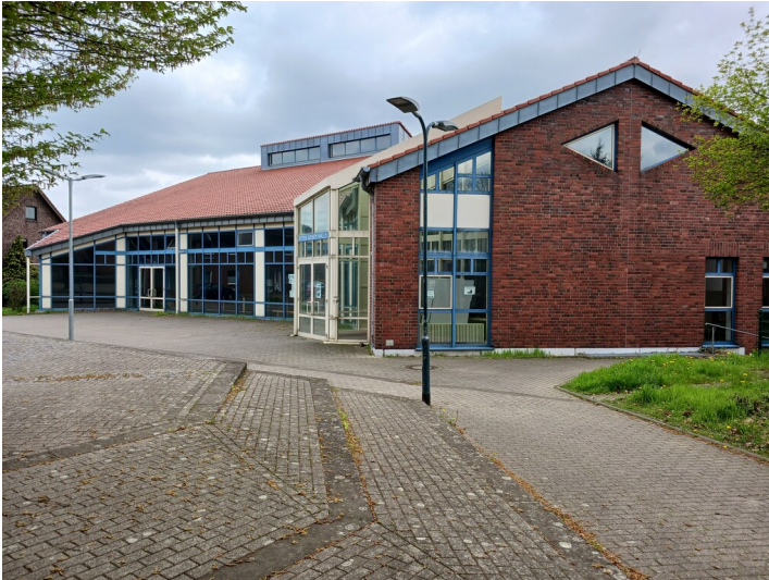
Front der Bürgerhalle zum Dorfplatz, Blick von Westen, rechts Westflügel, 15.4.2023