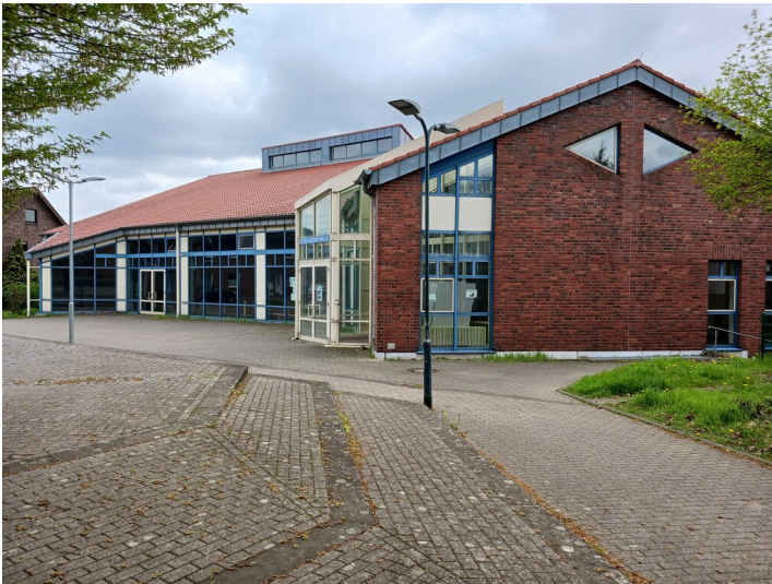
Front der Bürgerhalle zum Dorfplatz, Blick von Westen, rechts Westflügel, 15.4.2023