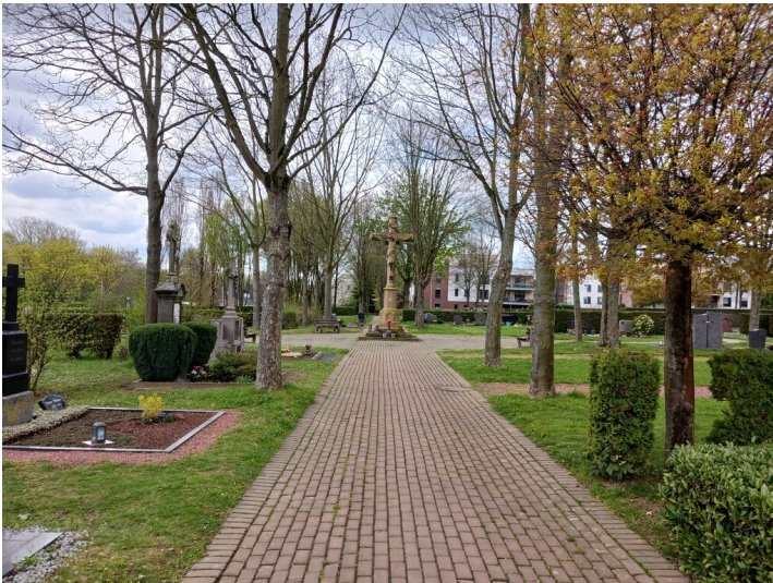
Garzweiler-Priesterath, Friedhof, Blick nach Westen, 15.4.2023