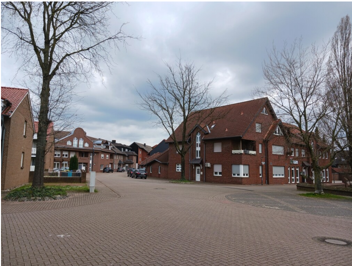
Jüchen, Umsiedlung Garzweiler, Ortsbild im Zentrum, 15.4.2023