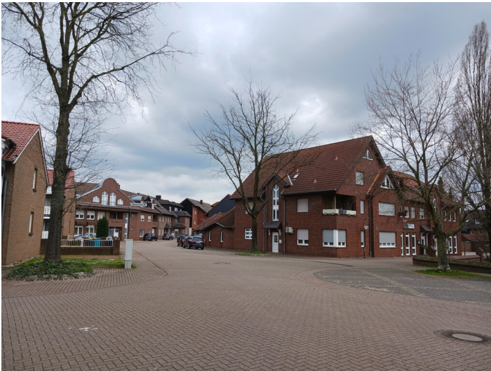
Jüchen, Umsiedlung Garzweiler, Ortsbild im Zentrum, 15.4.2023