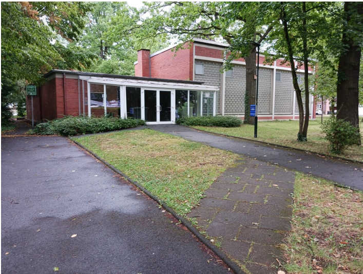
Kerpen-Neu-Bottenbroich, Mehrzweckhalle mit Foyer, Blick von Süden, 15.7.2023