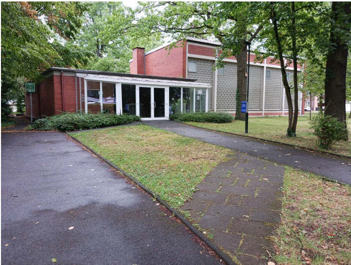
Kerpen-Neu-Bottenbroich, Mehrzweckhalle mit Foyer, Blick von Süden, 15.7.2023