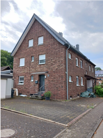
Kerpen-Neu-Bottenbroich, Haustyp (Buchenweg 16), 15.7.2023