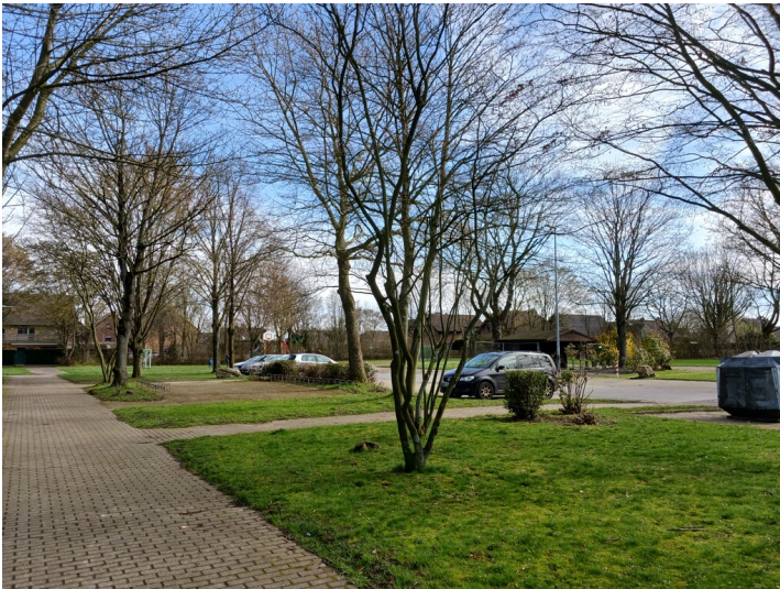
Königshoven, Schützenplatz, 28.3.2023