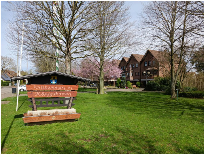
Königshoven, zentrale Grünanlage, Blick nach Osten, 28.3.2023