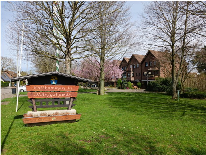
Königshoven, zentrale Grünanlage, Blick nach Osten, 28.3.2023