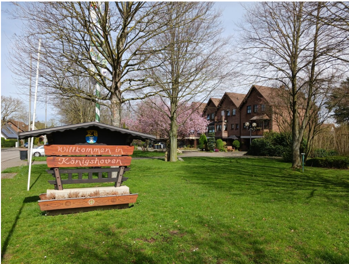
Königshoven, zentrale Grünanlage, Blick nach Osten, 28.3.2023